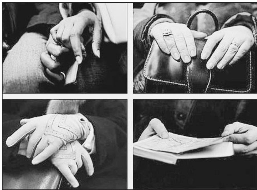
« J'ai choisi les mains parce qu'elles sont représentatives de la personne », explique l'artiste, qui a arpenté le métro parisien pendant dix-huit mois pour photographier des mains. (MATTHIEU GAUCHET.)

« L'idée de ce projet m'est venue en observant les voyageurs du métro, qui n'ont souvent rien d'autre à faire que d'attendre que le temps passe dans cet espace de promiscuité, explique-t-il. J'ai choisi les mains parce qu'elles sont représentatives de la personne, de son identité, de son âge, de sa place dans la société, voire de son état psychologique. » Agrippées l'une à l'autre, entrelacées ou tenant un sac ou un plan..., les mains deviennent de véritables photos d'art à travers l'œil de ce professionnel de l'image. « Toutes ont été systématiquement prises avec l'accord des personnes. Beaucoup de gens m'ont dit qu'ils n'avaient pas conscience de ce qu'ils faisaient de leurs mains dans le métro. » Jusqu'au 22 décembre, vous pouvez donc découvrir l'exposition d'une quinzaine de portraits noir et blanc au restaurant Taxi Jaune, dans le III e arrondissement.